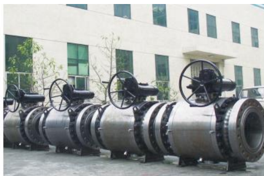
锻钢球阀 forged steel ball valve