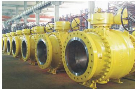
燃气球阀 ball valve for fuel gas