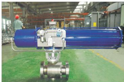
煤气化装置用锁渣阀 slag Lock valve used for Coal gasification